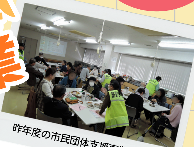
昨年度の市民団体支援事業の様子