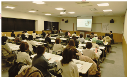
過年度講演会の様子