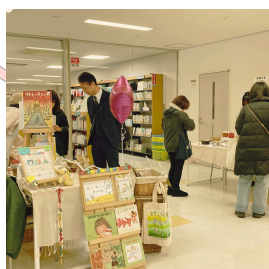
過年度チャレンジショップの様子