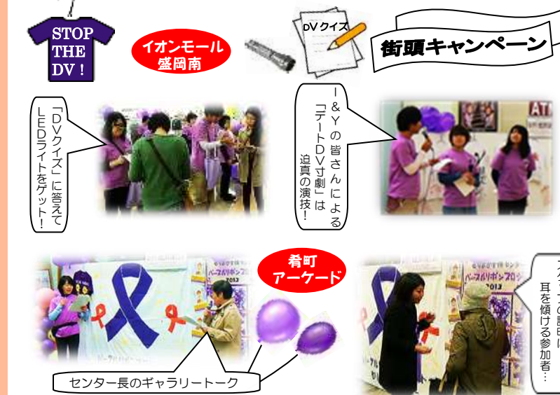
STOP THE DV!

「なくそう！女性に対する暴力 2014」を 11/14(金)～20(木)までの一週間開催しました。今年で 5 回目となる街頭啓発キャンペーンは、イオンモール盛岡南と肴町アーケードの 2 会場で展開しました。会場は、DV クイズやユースリーダー I & Y の皆さんによるデート DV 寸劇で大いに盛り上がりました。 今年度は、約 1,600 人の方々に参加ご協力をいただくことができました。ご来場いただきました皆様、街頭キャンペーンにご協力をいただきました皆様、ありがとうございました。