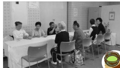
椅子に座って気軽にお茶席に参加