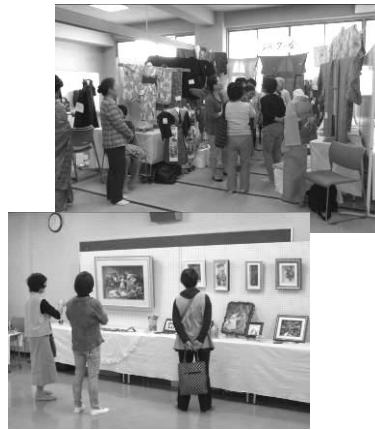
作品展示をご覧の皆さん