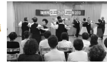
優雅な社交ダンスを披露