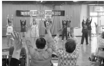
気功のポーズ。来場者の皆さんも一緒に！