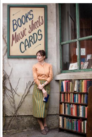
『マイ・ブックショップ』 (2017年/イギリス、スペイン、ドイツ)