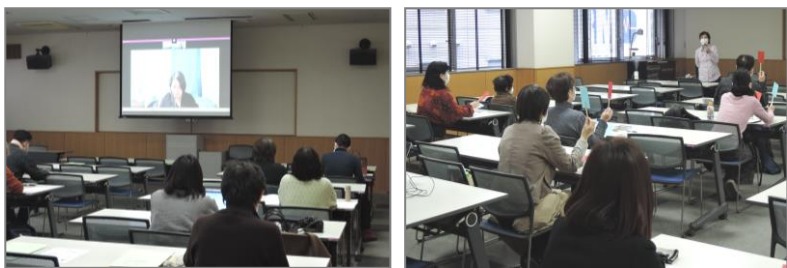
＼ オンライン講座の様子 ／ ＼ クロスロードゲームの様子 ／