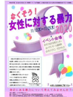
《女性センターのポスター》

※11月「児童虐待防止推進月間」 DVは子どもへの虐待にもつながり、切り離すことのできない問題です。