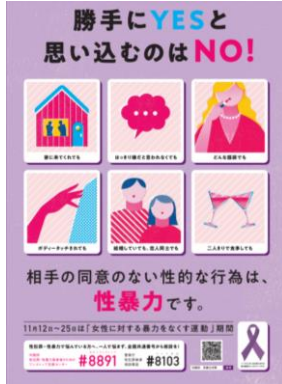
《今年度の内閣府のポスター》

※(株)東北電力ネットワーク岩手支社の鉄塔が11/12(木)~25(水)までパープルにライトアップします！