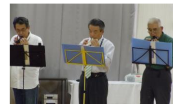
演技部門：オカリナ演奏