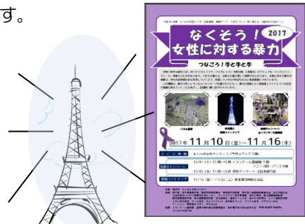
期間中、東北電力の鉄塔がパープルにライトアップ！ (協力：東北電力横岩手支店)

女性に対する暴力には、DV(ドメスティック・バイオレンス)や性犯罪、売買春、人身取引、セクハラ、ストーカーなどさまざまあります。女性に対する暴力の根絶に向けて、期間中市内2カ所街頭啓発キャンペーンを展開します。