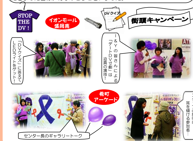
STOP THE DV!

今年度は、約 1,600 人の方々に参加ご協力をいただくことができました。ご来場いただきました皆様、街頭キャンペーンにご協力をいただきました皆様、ありがとうございました。