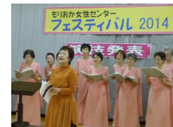
演技部門：コーラス

また、起業応援ルームでは過去5年間のフェスティバルの写真を展示し多くの皆様にご覧いただき、フォトアルバム作りにも挑戦していただきました。