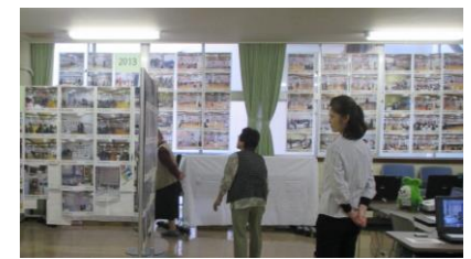
起業応援ルームいっぱい写真展示