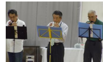
演技部門：オカリナ演奏