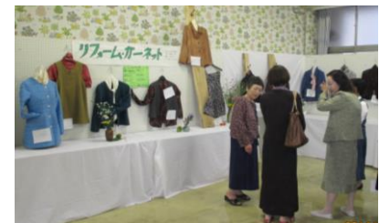
展示部門：リフォーム作品