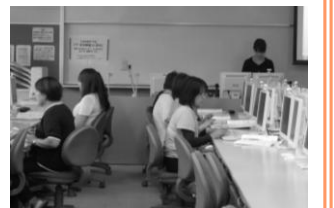
IT 活用講座 in 宮古

「女性起業芽でる塾」は、入門編では起業に興味がある、いつか起業してみたいと思っている女性を対象に、先輩女性起業家の体験談を聞き、実践編では、起業の基礎知識を知り、具体的な一歩を踏み出す行動計画を作成しました。