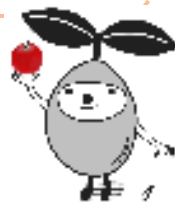
起業応援キャラ： めでるちゃん