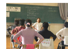
座りながら簡単ストレッチ!

50代以上の女性を対象にした応援講座で、25名が参加しました。相手をほめるワークや色彩の効用、ストレッチの呼吸法などから、自信をもって活動する方法を学びました。