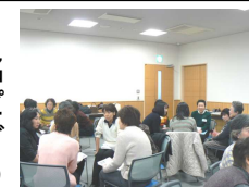
それぞれの思いを語りました

30代から80代までの定員を超える女性53名が参加。県内高齢者の意識調査の結果やホスピスの現状について学んだあと、受講生同士でグループになり、自分が望む医療や家族との関わり方などを話し合いました。