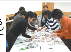
週刊誌に描かれた男女をコラージュで分析!

30代から70代までの女性22名が参加。子ども向けのマンガや雑誌、大人向けの週刊誌、テレビCMを題材にメディアを読み解く力、発信する力について学習しました。