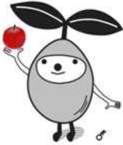
起業応援キャラクター 「めでるちゃん」

岩手の農業と女性パワーを、ITを活用して発信しませんか？ おいしい食材がたくさんある岩手だからこそできる「起業」の自分流プラン作りを応援する入門講座です。「こんな起業を始めたい！」「ITを自分の起業活動に活用してみたい」と考えている女性農業者のみなさんのご参加をお待ちしています！